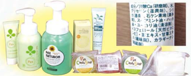
合成界面活性剤不使用の石けんなど